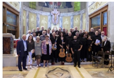
Foto ricordo con gli orchestrali e gli ospiti

Il pomeriggio di festa si è concluso con delle foto ricordo e con un ricco buffet offerto dall'Associazione.